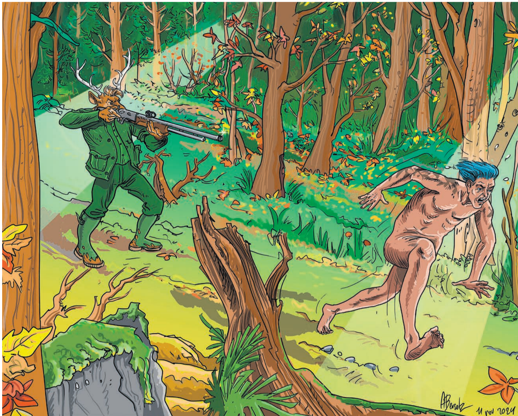
Les cerfs dans nos bois, lire l'article en page 6.

Abonnement de soutien: 30 francs IBAN: CH63 8080 8001 7443 4211 3 Sociétés, clubs et associations : 100 francs